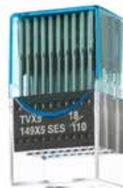
Set de agujas