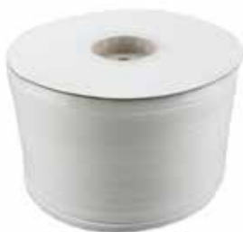
Rollo de tira tensora PVC