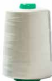
Rollo de hilo